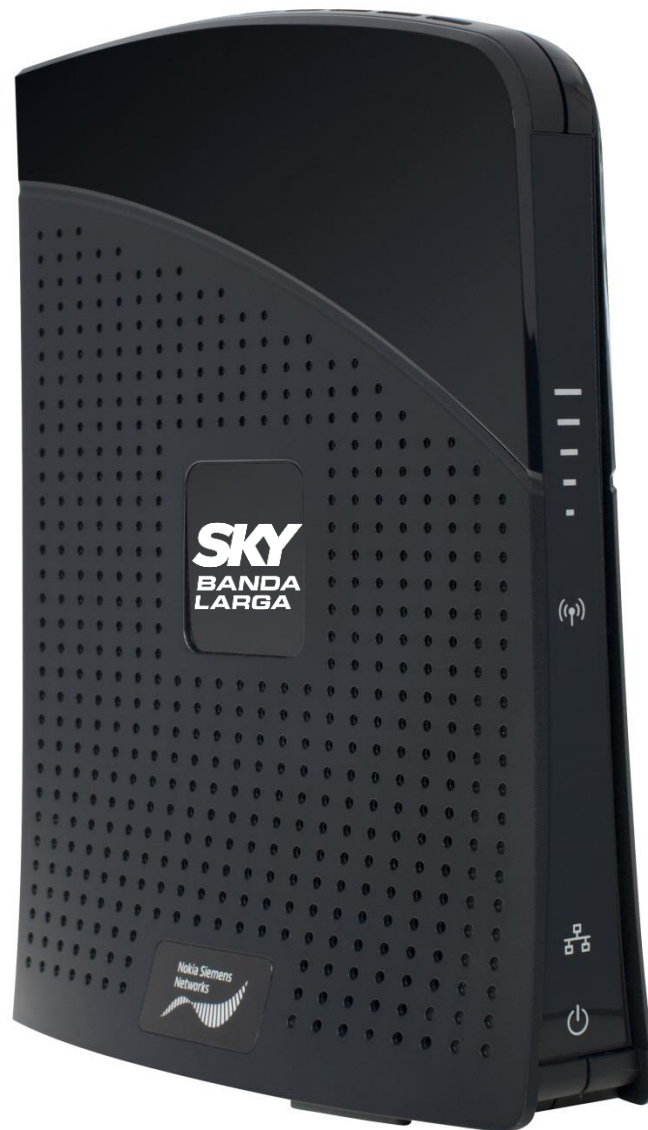
Imagem do modem Nokia